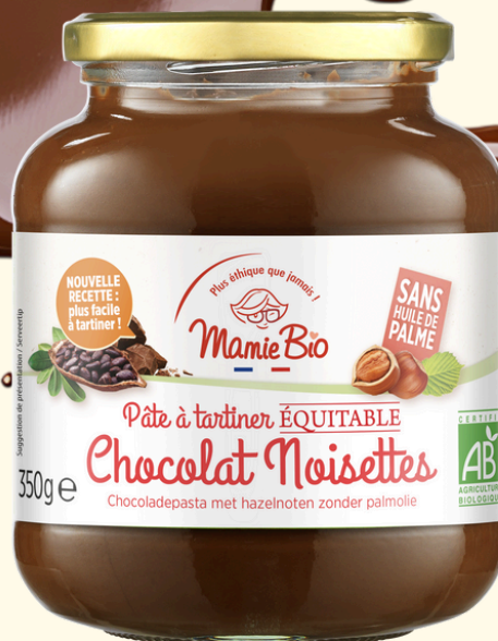
PÂTE A TARTINER CLASSIQUE 350G