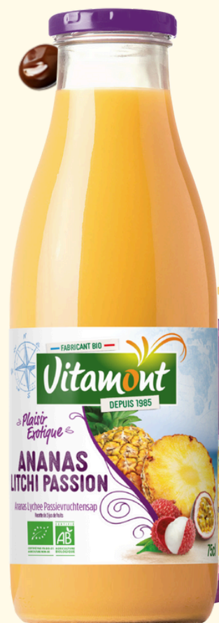
COCKTAIL DE PUR JUS ANANAS LITCHI PASSION