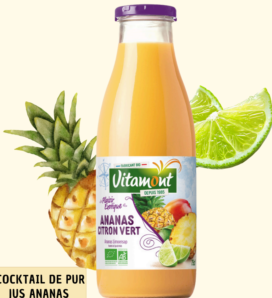
COCKTAIL DE PUR JUS ANANAS CITRON VERT